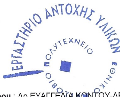
Δρ Β. ΒΑΔΑΛΟΥΚΑ

Υπεύθυνος Αναθεώρησης Εγγράφου : Δρ ΕΥΑΓΓΕΛΙΑ ΚΟΝΤΟΥ-ΔΡΟΥΓΚΑ